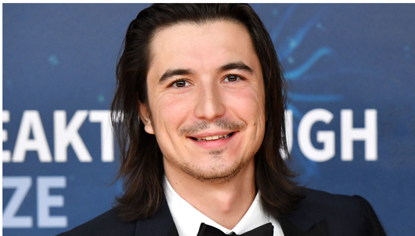
Сооснователь и согендиректор Robinhood Markets Владимир Тенев